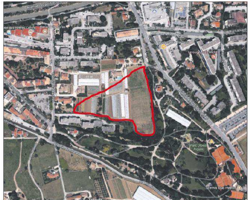
Le projet Green Park de Vinci immobilier comprend trois bâtiments pour 165 logements, sur un terrain attenant au jardin Olbius-Riquier.

Les riverains du jardin Olbius-Riquier ont appris l'existence d'un projet immobilier entre le chemin du Martinet et l'avenue Ambroise-Thomas, avec l'affichage de l'arrêté de permis de construire en date du 20 février 2017. Sur ce terrain de 17000 m 2 , Vinci immobilier résidentiel prévoit 165 logements dont 45 locatifs sociaux, trois bâtiments de R+2 à R+4 pour 8500 m 2 de surface de plancher et 15 m de hauteur maximum à l'égout du toit.